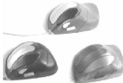
Fig.3. Modelos de Mouse Ortopédico. Destaque: 5 diferentes acessórios de adaptação a mãos e dedos.